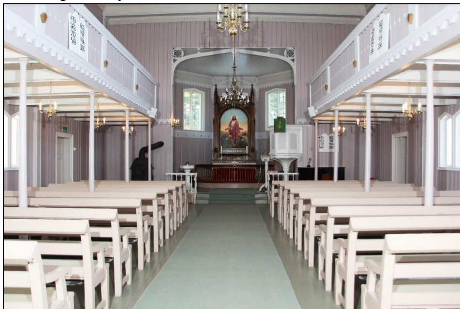
Interiør fra Engene kirke.

leiligheter). Man fant, etter undersøkelser, ut at den tomten ikke egnet seg samtidig som man mente den lå for langt unna byens sentrum.