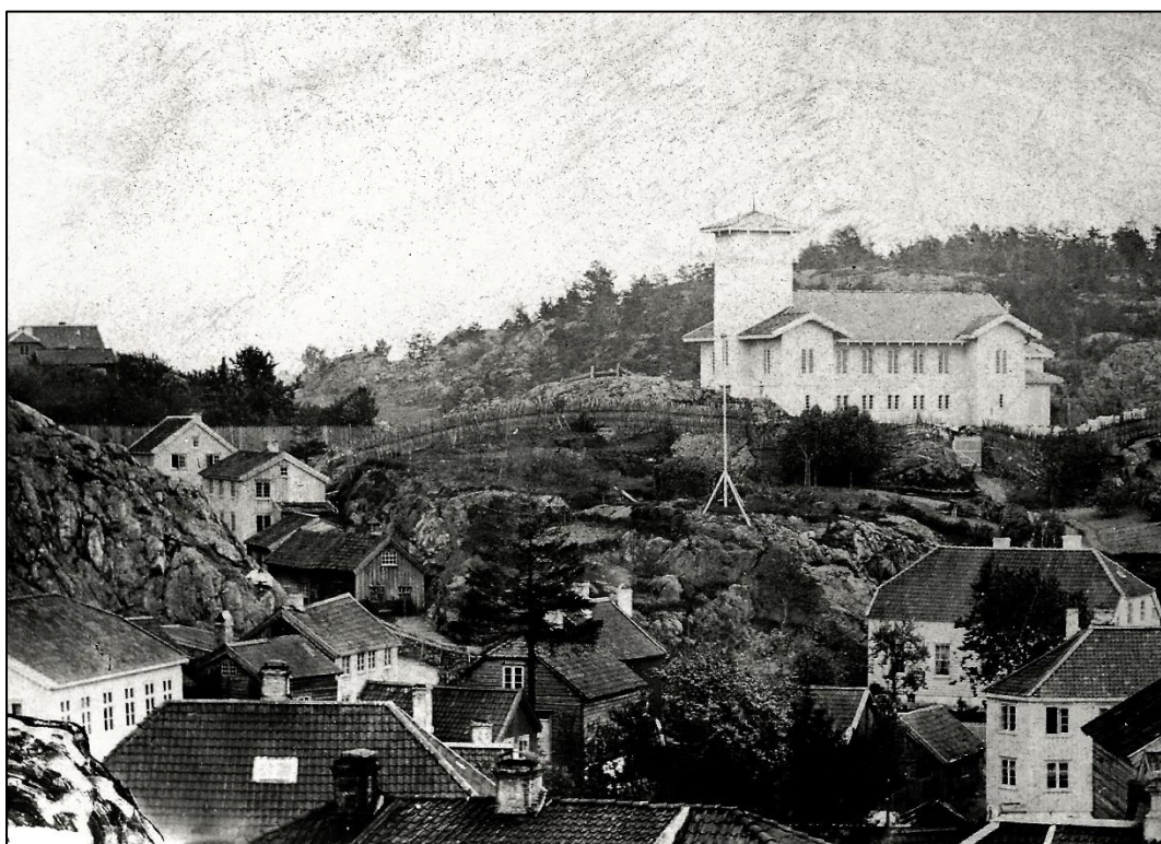
Fotografi av Grimstads første kirke.

Det er typisk for slike bilder med utsyn å ha personer i forgrunnen som ser utover. Det er med på å skape dybde i bildet. Til venstre kan man følge landskapet nedover (der hvor nå Voss bakke går) mot Dramsviga og videre utover til havnen med den store sjøboden på Torskeholmen og noe av bebyggelsen innenfor. Ytterst, innfor en sjøbod, ser man «Tønnevolds hus» og bak det taket på Sorenskrivergården. Litt til høyre er et høyt, hvitt hus med sort, valmet tak. Mange i Grimstad husker dette som «Gunda Hansens hus». Det ble revet da området der lyskrysset nå er ble utvidet. Seilskutene på havnen har tydelig klipperbaug. I bakgrunnen ses Odden og Gundersholmen. Videre vestover kan landskapet følges mot horisonten. Til høyre domineres bildet av kirken. Det er en langkirke med utbygginger i de fire hjørnene som innvendig fungerte som trappehus. Stilen er litt ubestemmelig, men kan være en forløper til sveitserstilen som kom til Norge i begynnelsen i 1840-årene. Riksantikvaren regner den i alle fall som en av de første bygningene i sveitserstil på Sørlandet.