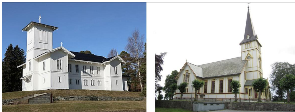
Engene kirke slik den fremstår i dag og den nåværende kirke i Grimstad.

Grimstads nåværende kirke ble bygd i 1881 i bindingsverk, og stilen regnes som nygotikk. Opprinnelig var det 1125 sitteplasser i kirken. Arkitekt var Henrik Thrap-Meyer (1833-1910) og byggmester Johan Gottlieb Heinecke (1833-1912). Malerarbeidet ble utført av Lauritz Hansen.