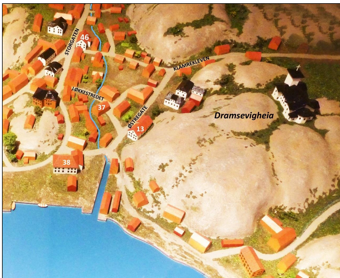
Utsnitt av bymodellen av 1847. Grimstad bys museer.