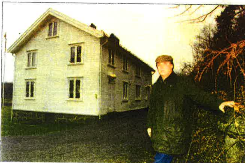
VÅNINGSHUSET fra 1860-årene er ferdigrestaurert og inneholder to flotte leiligheter, samt soslalrom for folkenesom jobber på Løvåsvolden og Storegra. – Nå er det bare to porter